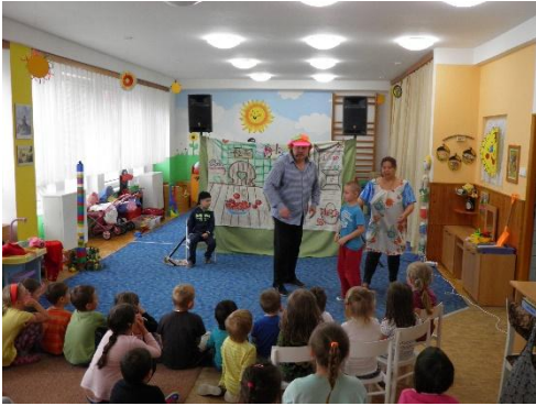
Oblíbené divadélko „Řimbaba“.