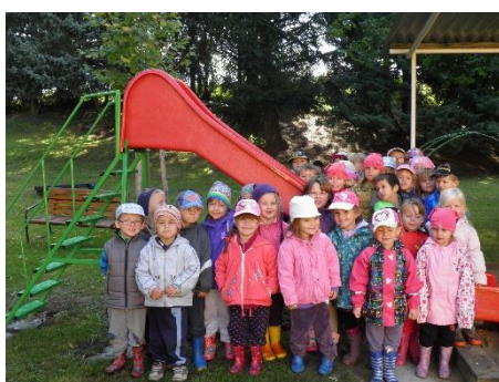
Radost z nové skluzavky.

Koncepce programu je zaměřena tak, aby dovedla dítě na konci předškolního období k tomu, aby v rozsahu svých osobních předpokladů získalo věku přiměřenou fyzickou, psychickou a sociální samostatnost s přihlédnutím na jeho další rozvoj, aby se naučilo jednat v duchu základních lidských a etických hodnot, a to na úrovni předškolního věk.