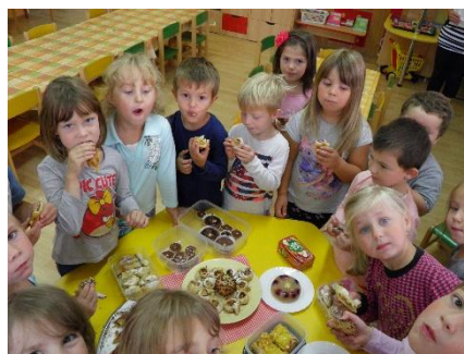
Jablíčkový den u Krtečků a u Ferdů.