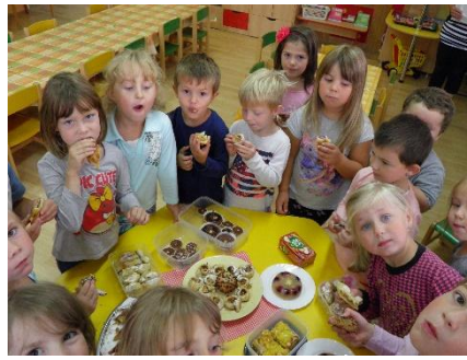
Jablíčkový den u Krtečků a u Ferdů.