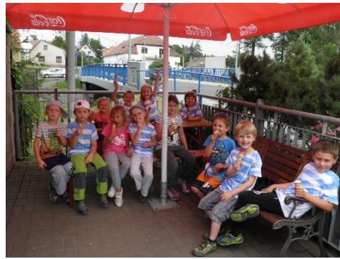
Sladký konec školního roku.